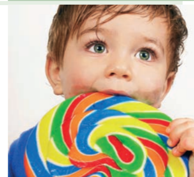
Dauerlutschen schadet den Zähnen